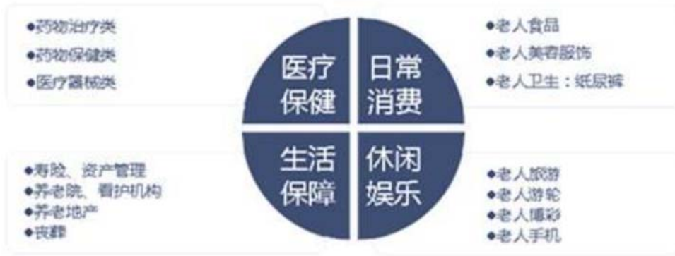
我国养老产业链结构图